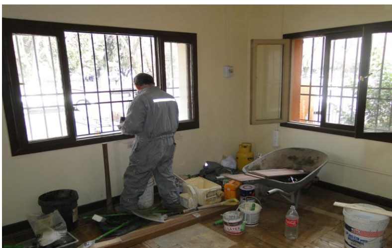
MEJORAMIENTO OFICINAS DE TURISMO