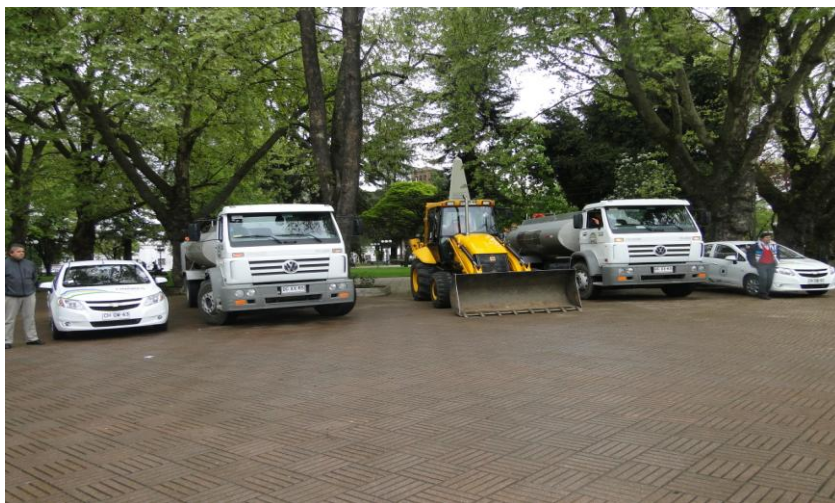
NUEVOS VEHICULOS MUNICIPALES