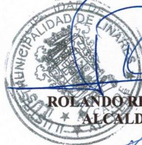
ROLANDO RENTERÍA MÖLLER ALCALDE DE LINARES